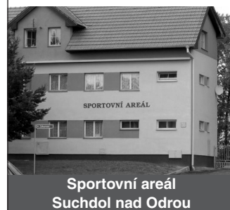
Sportovní areál Suchdol nad Odrou

Zájemci o účast pište na e-mail: odbory@tonak.cz nebo telefonujte na číslo 556 202 470.