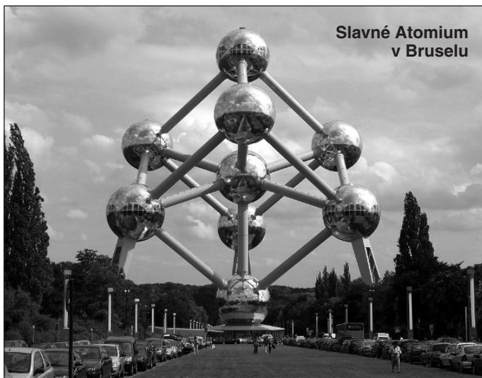
Slavné Atomium v Bruselu